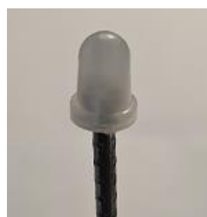
Plastskydd för spetsen. PS-250.