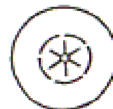
RC100, Ø 25MM