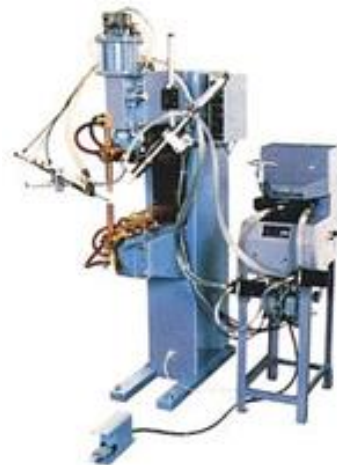
Exempel på högkapacitetsmatare för två olika mutterdimensioner.

För att få en hög kapacitet vid muttersvetsning används olika typer av matare. Det finns matare för muttrar, skruvar och andra komponenter. Eftersom matare ofta är kundanpassade beroende på typ av mutter, kvalitetskrav etc, kan du kontakta oss för mer information.