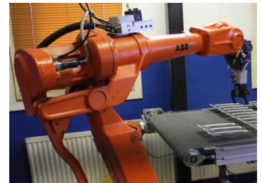
Exempel på layout av komplett cell.