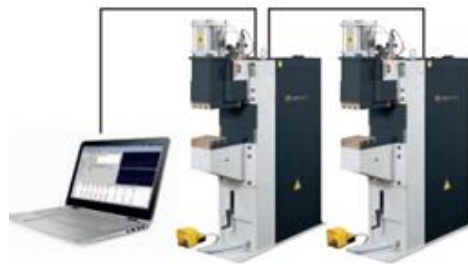
Presssvetsmaskiner kopplade i nätverk.

Val av svetsmaskin utgår från dimension och material på mutter/ skruv. Samt kapacitetskraven på processen. Valet av svetsvakt styrs av kvalitets- och dokumentationskrav.