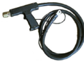
Pistol för enkelsidig svetsning. Finns med och utan vattenkylning.