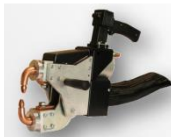
X- tång med presskraft på 370 eller 560 daN.