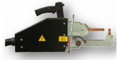
Inverter C- tång med presskraft på 430 eller 600 daN.