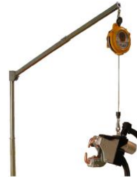
Stödarm med balansblock för tången.