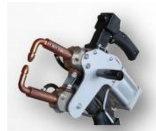
X- tång, finns med och utan vattenkylning. Max presskraft 245 daN.