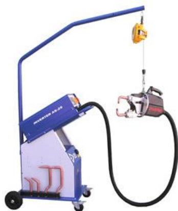
AS 25- 13K