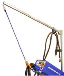
Stödarm för avlastning av svetskablar.