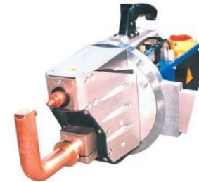
PN8C PN12C PN18C PN25C